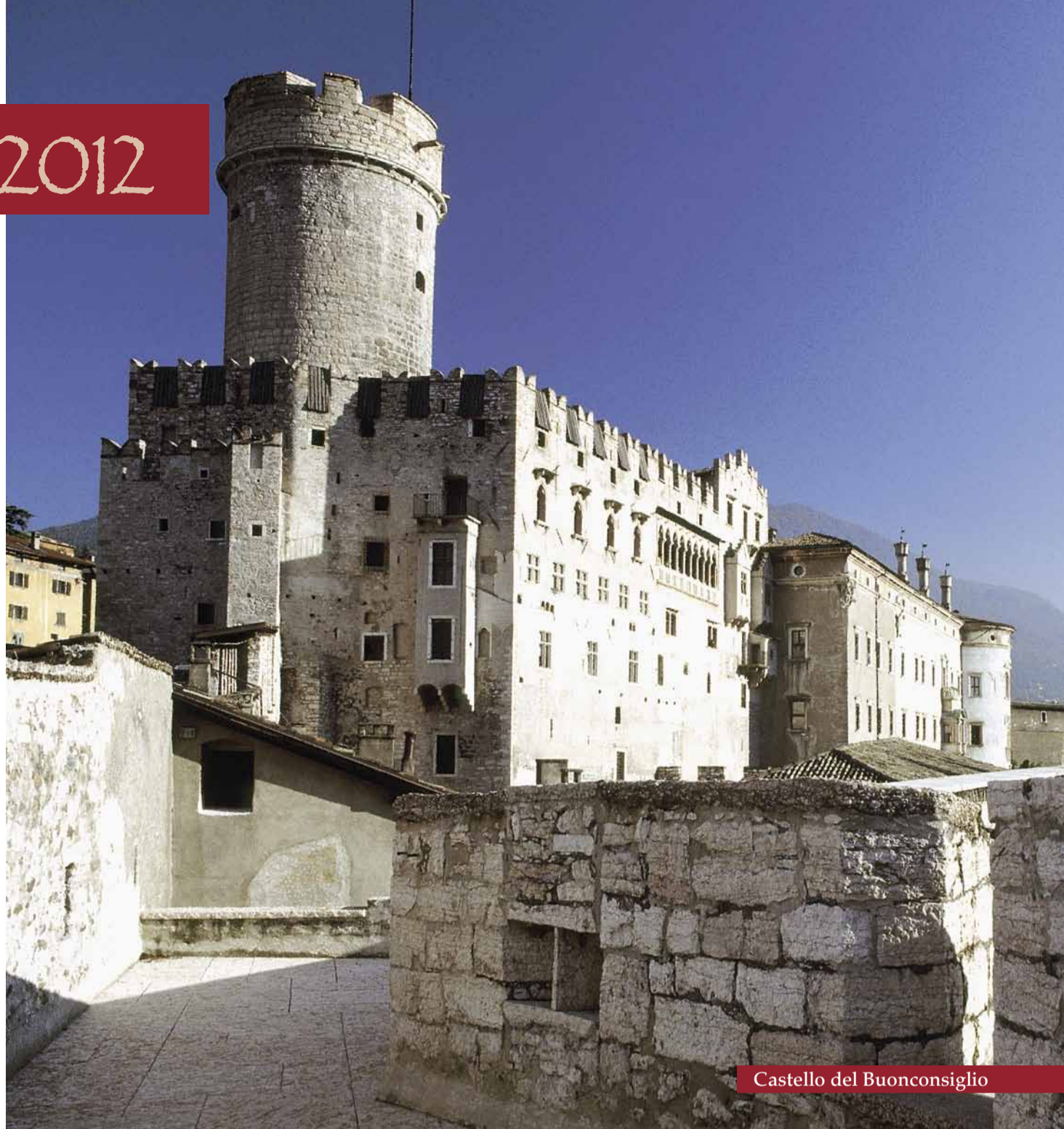
Castello del Buonconsiglio