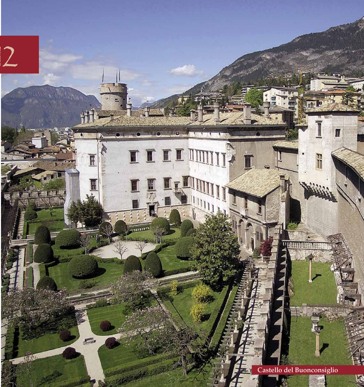
Castello del Buonconsiglio