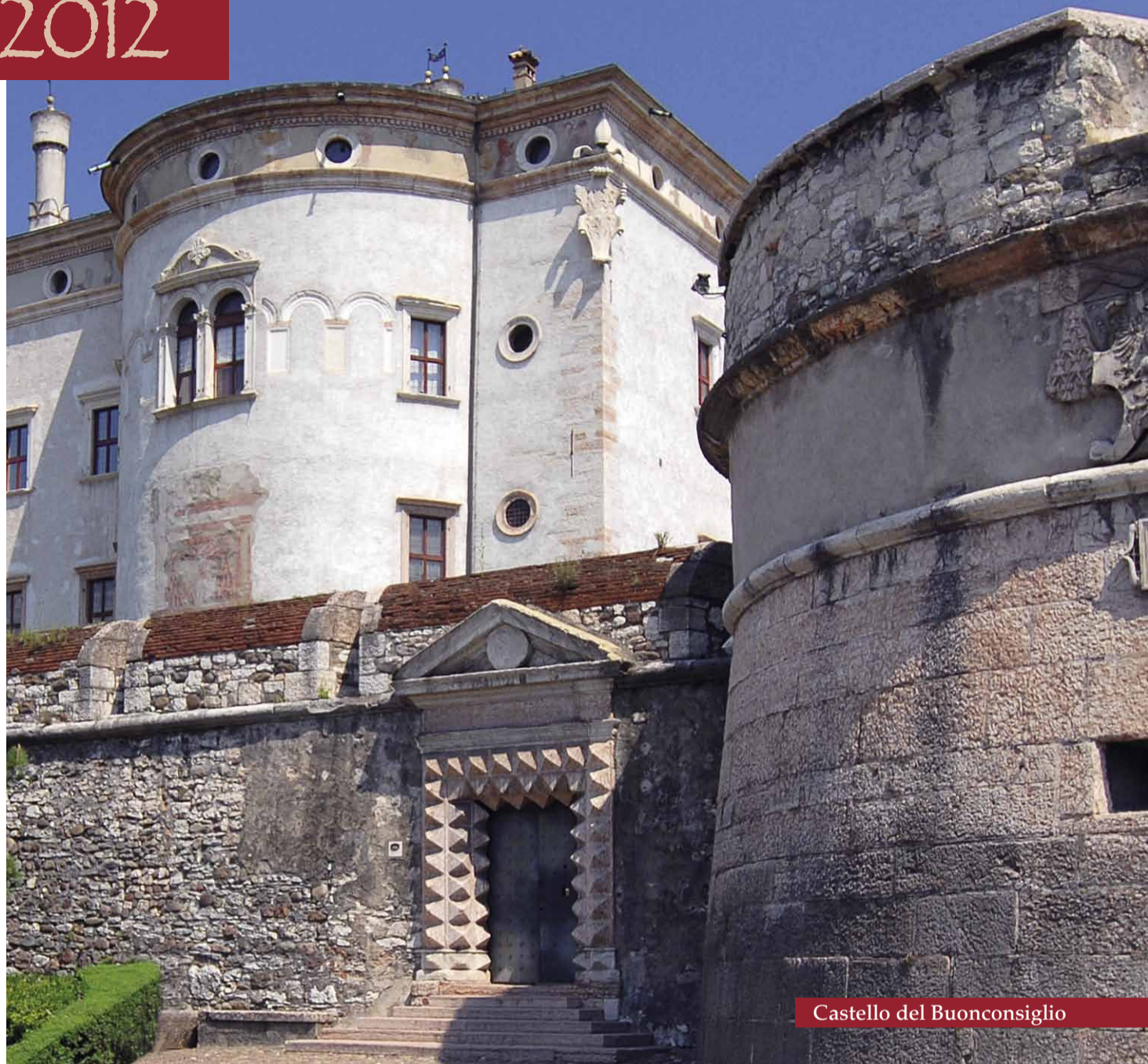
Castello del Buonconsiglio